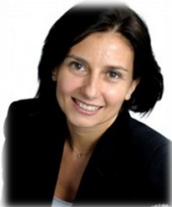
Д-р. Роберта Рэ, Генеральный директор Всемирной организации по исследованию сахара (WSRO)